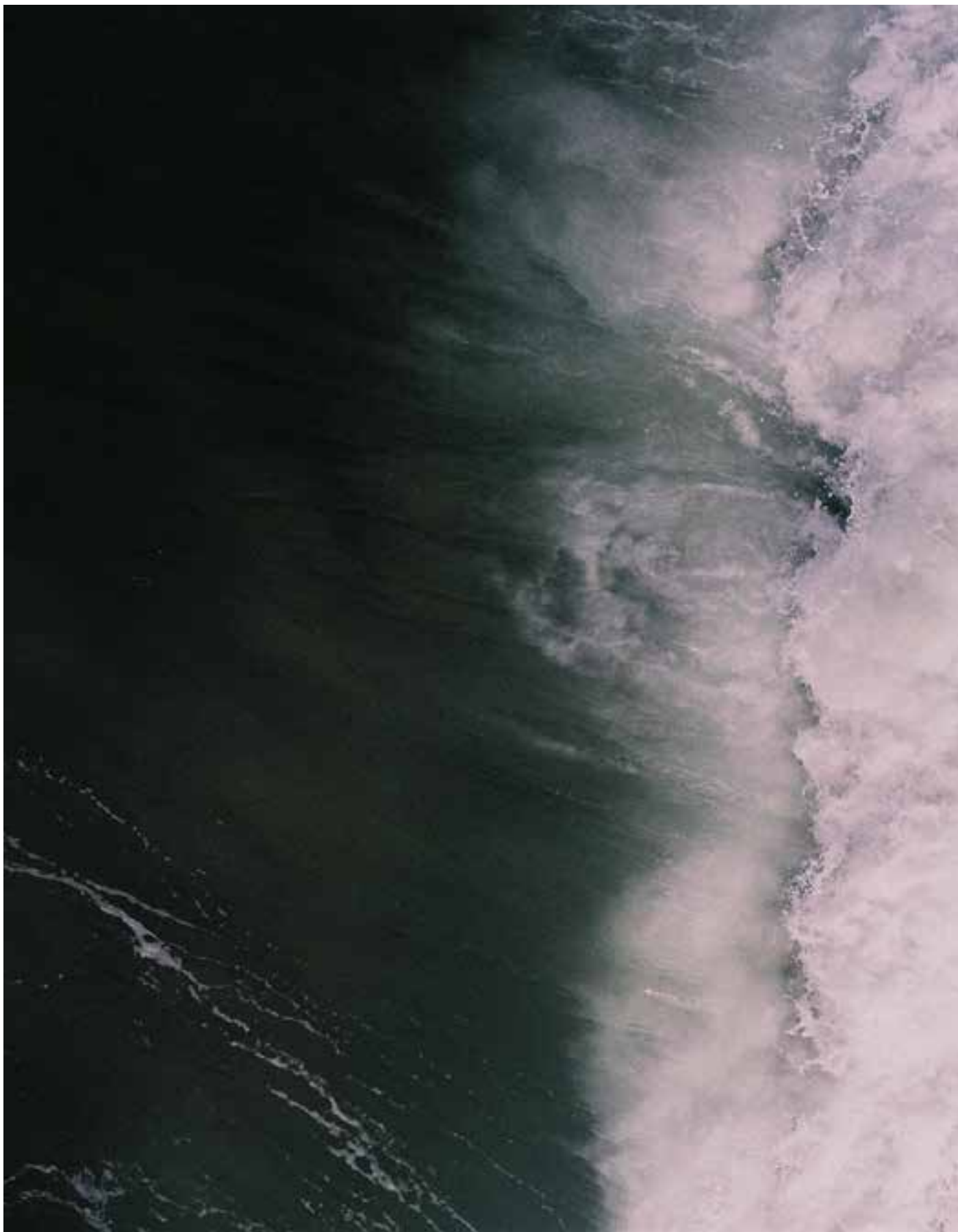
UNTITLED, 2013 85x120 cm