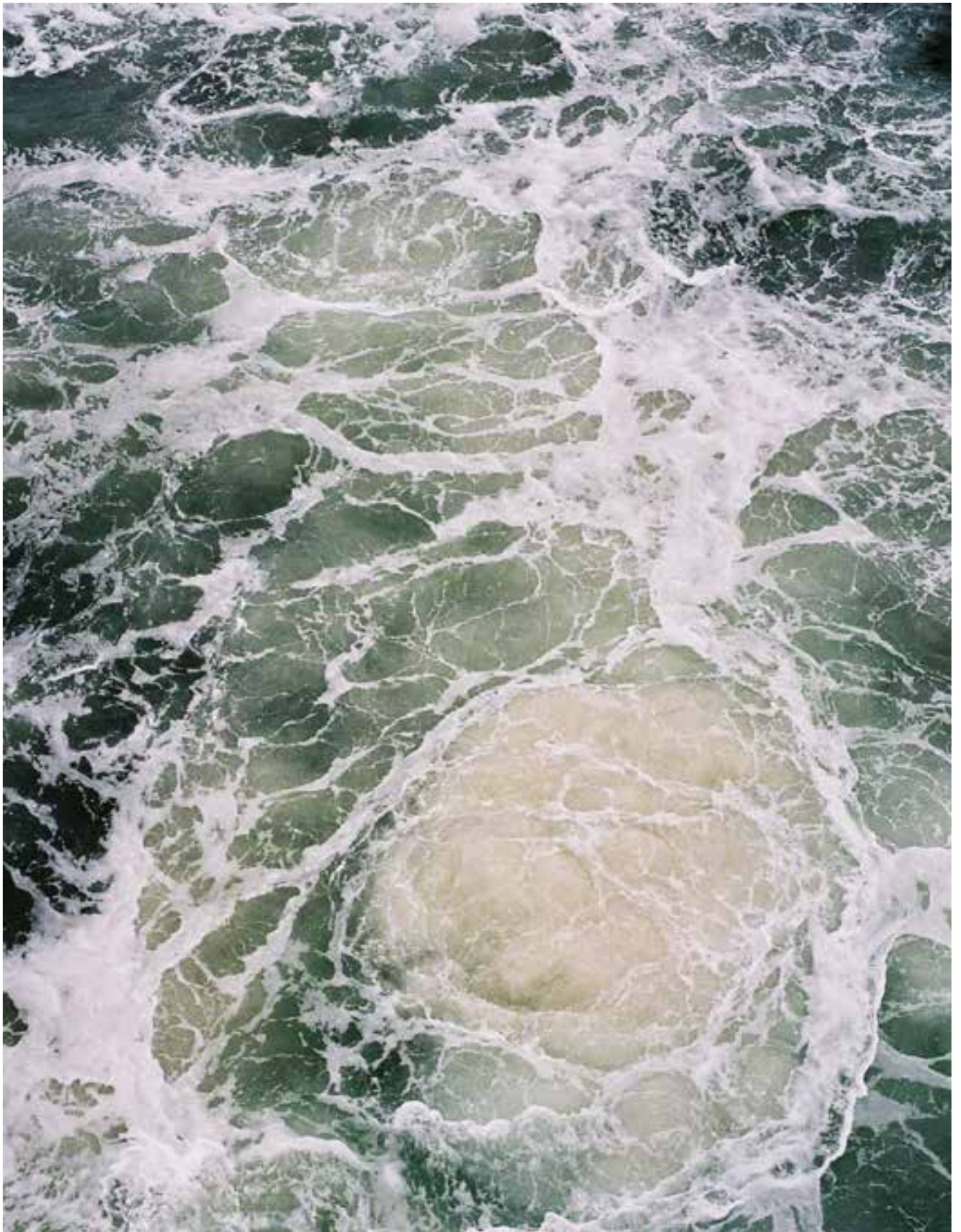
UNTITLED, 2013 40x60 cm