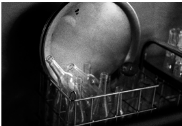
FEEST 21 x 29,7 cm PARIJS A 21 x 29,7 cm DANS 21 x 29,7 cm