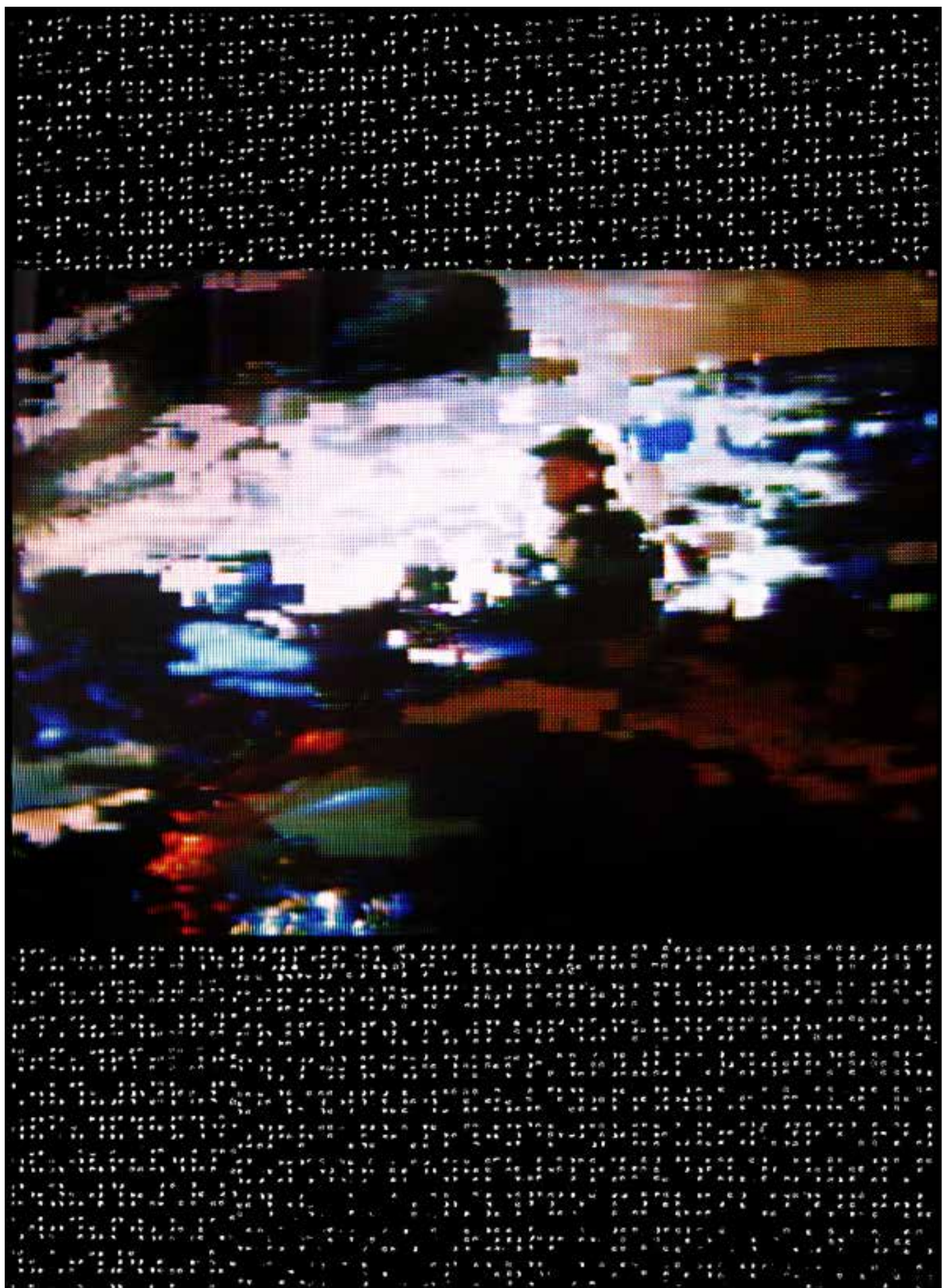
CONTAMINATION 60 X 80 cm Papier photographique poinçonné Perforated photographic paper