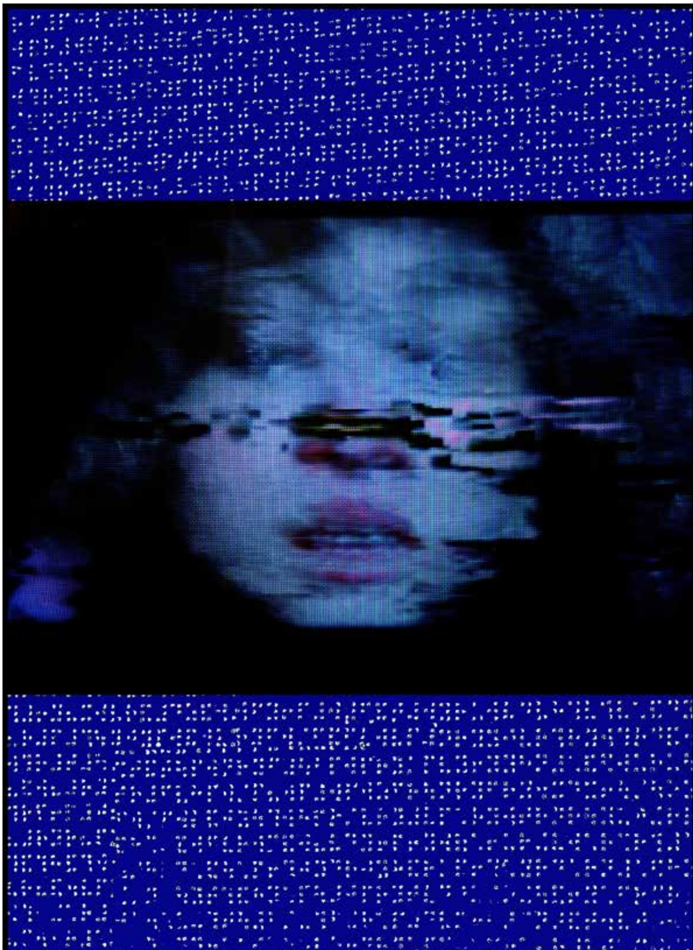
CONTAMINATION 3 60 X 80 cm Papier photographique poinçonné Perforated photographic paper