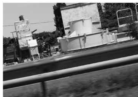
PAYSAGE 1 - 2012 50x23 cm dimension image 40x9 cm Tirage photographique / photoprinting BW Ilford 1/5