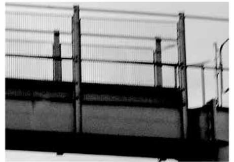
PASSERELLE - 2010 30x21 cm dimension image 22x5 cm Tirage photographique BW Ilford 1/10