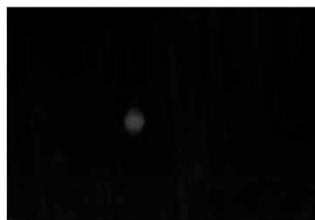
ROUTE 1 - 2010 50x23 cm dimension image 40x9 cm Tirage photographique / photoprinting BW Ilford 1/5