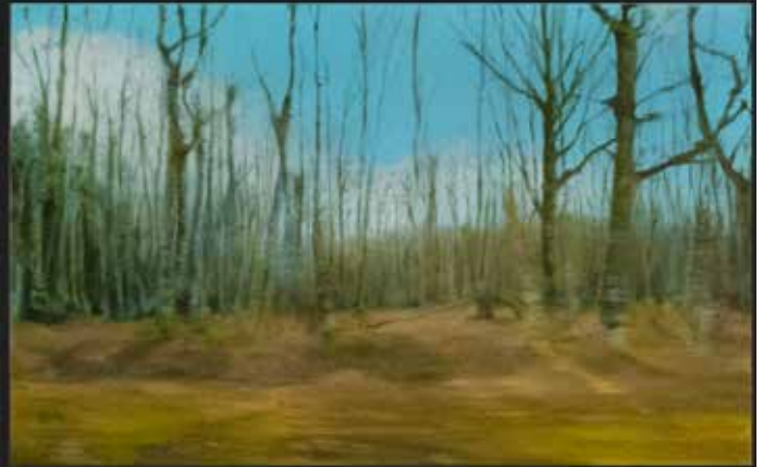
TRAVELING 30x30 cm Peinture huile et acrylique sur bois / Oil and acrylic on wood