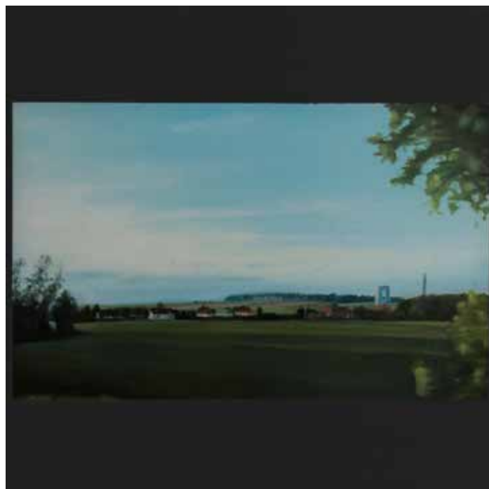
TRAVELING 30x30 cm

Peinture huile et acrylique sur bois / Oil and acrylic on wood