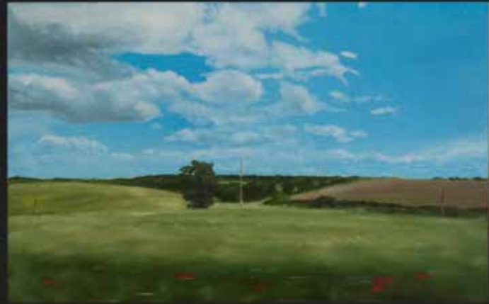
TRAVELING 30x30 cm Peinture huile et acrylique sur bois / Oil and acrylic on wood