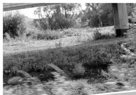
PAYSAGE 2 - 2012 50x23 cm dimension image 40x9 cm Tirage photographique / photoprinting BW Ilford 1/5