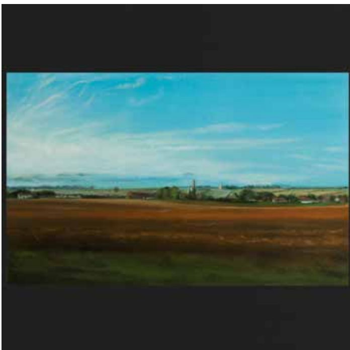
TRAVELING 30x30 cm

Peinture huile et acrylique sur bois / Oil and acrylic on wood