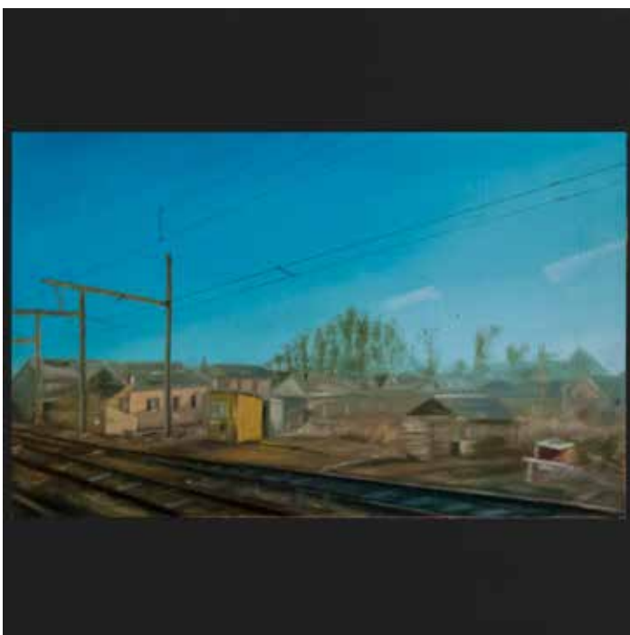
TRAVELING 30x30 cm

Peinture huile et acrylique sur bois / Oil and acrylic on wood