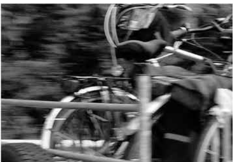
REMORQUE - 2012 50x23 cm dimension image 40x9 cm Tirage photographique BW Ilford 1/5