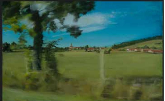
TRAVELING 30x30 cm Peinture huile et acrylique sur bois / Oil and acrylic on wood