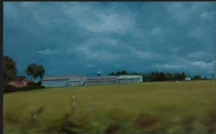
TRAVELING 30x30 cm Peinture huile et acrylique sur bois / Oil and acrylic on wood